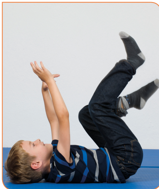
Abb. 3: Die Arme und Beine kräftig strampelnd durch Schüttelbewegungen lockern.

Szene 3: „Wie lästig diese Fliegen sind!“, denkt sich Katze Kasi. Um die Fliegen zu vertreiben, beginnt sie kräftig mit allen Vieren zu strampeln [vgl. Abb. 3]. Übung 3 – Fliegen verjagen: Die in die Luft gestreckten Arme und Beine in kleinen Schüttelbewegungen lockern. Wichtig: Zur Stabilisation der Wirbelsäule Bauch einziehen, Ellbogen- und Hand- sowie Knie- und Fußgelenke locker lassen.