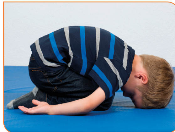
Abb. 10b: Oberkörper zusammenrollen und die Schultern in Richtung Boden fallen lassen.

Augen, holt noch ein paar Mal tief Luft und schon ist sie friedlich eingeschlafen. Übung 10 – Katzenkörbchen: Die Knie werden in den Vierfüßlerstand abgesetzt, dann das Gesäß auf die Fersen abgesetzt und der Oberkörper in den Fersensitz angehoben. Ein paarmal kräftig gähnen, die Arme zuerst weit nach oben strecken und dann seitlich absenken. Die Handrücken werden neben dem Körper am Boden abgelegt, das Kinn neigt sich zur Brust, der Oberkörper wird eingerollt und ganz locker auf den Oberschenkeln abgelegt. Der Kopf wird vorsichtig vor den Knien auf der Matte aufgestützt. Augen schließen und ganz tief ein- und ausatmen. Wichtig: Die Schultern fallen in Richtung Boden, der Rücken ist rund. Variationen: Die Oberschenkel können auch etwas gespreizt werden, falls diese Haltung unangenehm sein sollte. Auch lässt sich der Kopf auf einen „Fäusteturm“ ablegen.