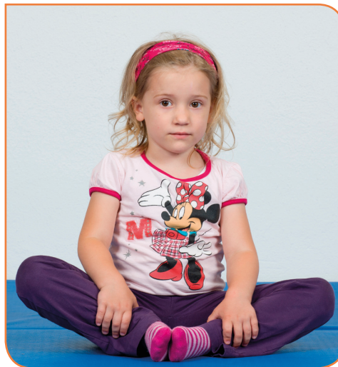
Abb. 6a-b: Am Boden absitzen. Dann die die Fußsohlen vor dem Körper zusammenführen und leicht auf- und abfedern.